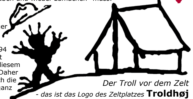
Der Troll vor dem Zelt

Wir Scheuburger waren übrigens bereits 1994 und zuletzt 2006 auf diesem Zeltplatz. Daher kennen sich die Leiter da ganz gut aus.